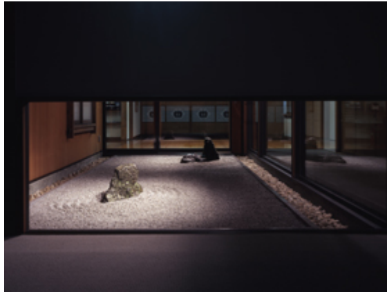
Obr. č. 7 – “Cho-Setsu-Ko” (Shunmyo Masuno, 2014: Domestic works)