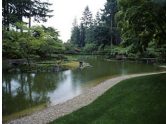
Obr. č. 9 – Nitobe Memorial Garden (Shunmyo Masuno, 2014: Overseas works)