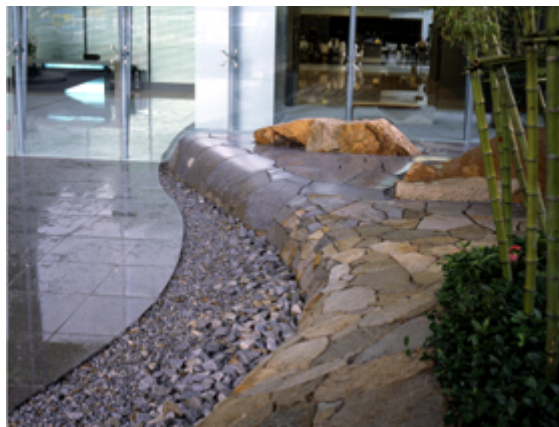
Obr. č. 11 – „SanSjin-Tei“ (Shunmyo Masuno, 2014: Overseas works)

Výrazný interiér opět s kamennými prvky, které jsou záměrně největší dominantou.