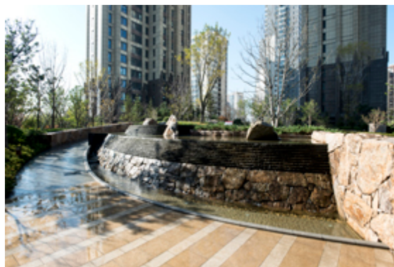
Obr. č. 14 – „Ryuun-tei“ (Shunmyo Masuno, 2014: Overseas works)

Zahrada, která vyčnívá především kontrastem mezi broušeným a přírodním kamenem.