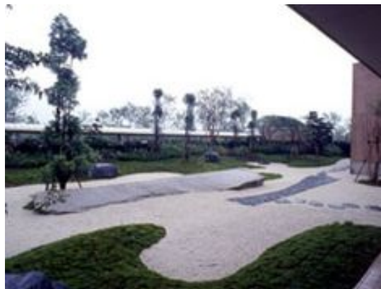
Obr. č. 5 – museum moderního umění - Niigata (Shunmyo Masuno, 2014: Domestic works)

Na této realizaci mi přijdou nejzajímavější ostré přechody mezi travnatou plochou a štěrkem.