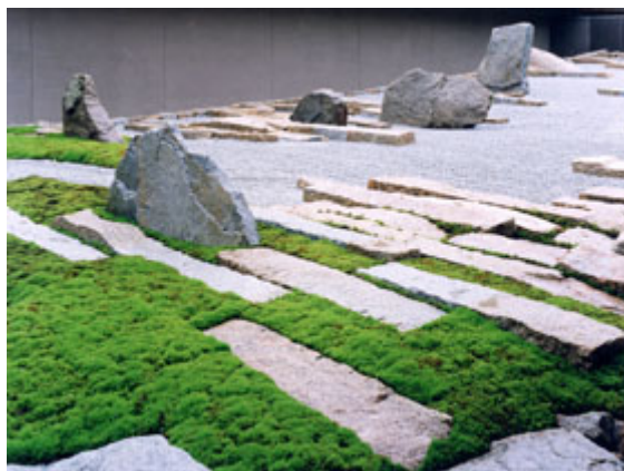
Obr. č. 6 – “Yu-Kyu-En” (Shunmyo Masuno, 2014: Domestic works)

Jednalo se o další prostor krematoria, atriovou zahradu, která se lišila od všech předchozích především svou velikostí a použitím obdélníkových bílých kamenů v trávě v kontrastu s bílým štěrkem. Prostor má zcela jedinečnou kompozici jak v pohledu zevnitř budovy, tak i prostému pohledu ve venkovních prostorách.