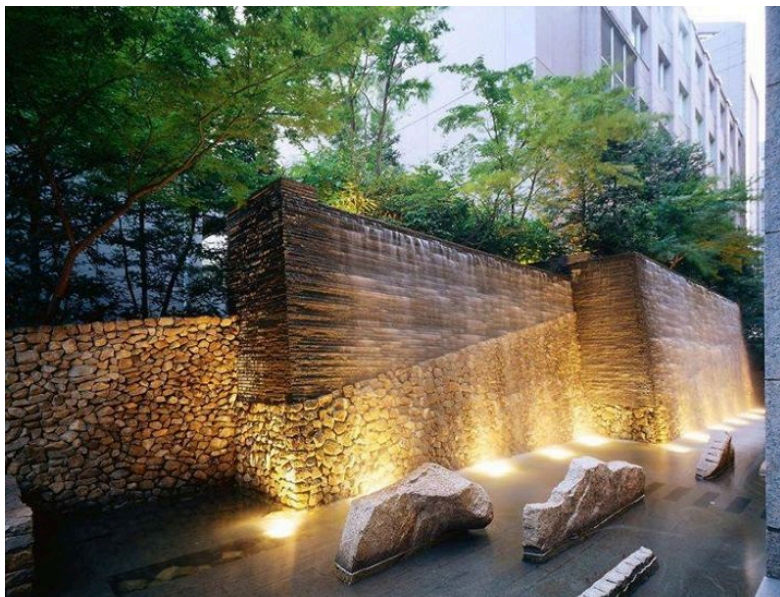
Obr. č. 2 – Asi nejslavnější práce Masuna – moderní zenová zahrada v Tokyu