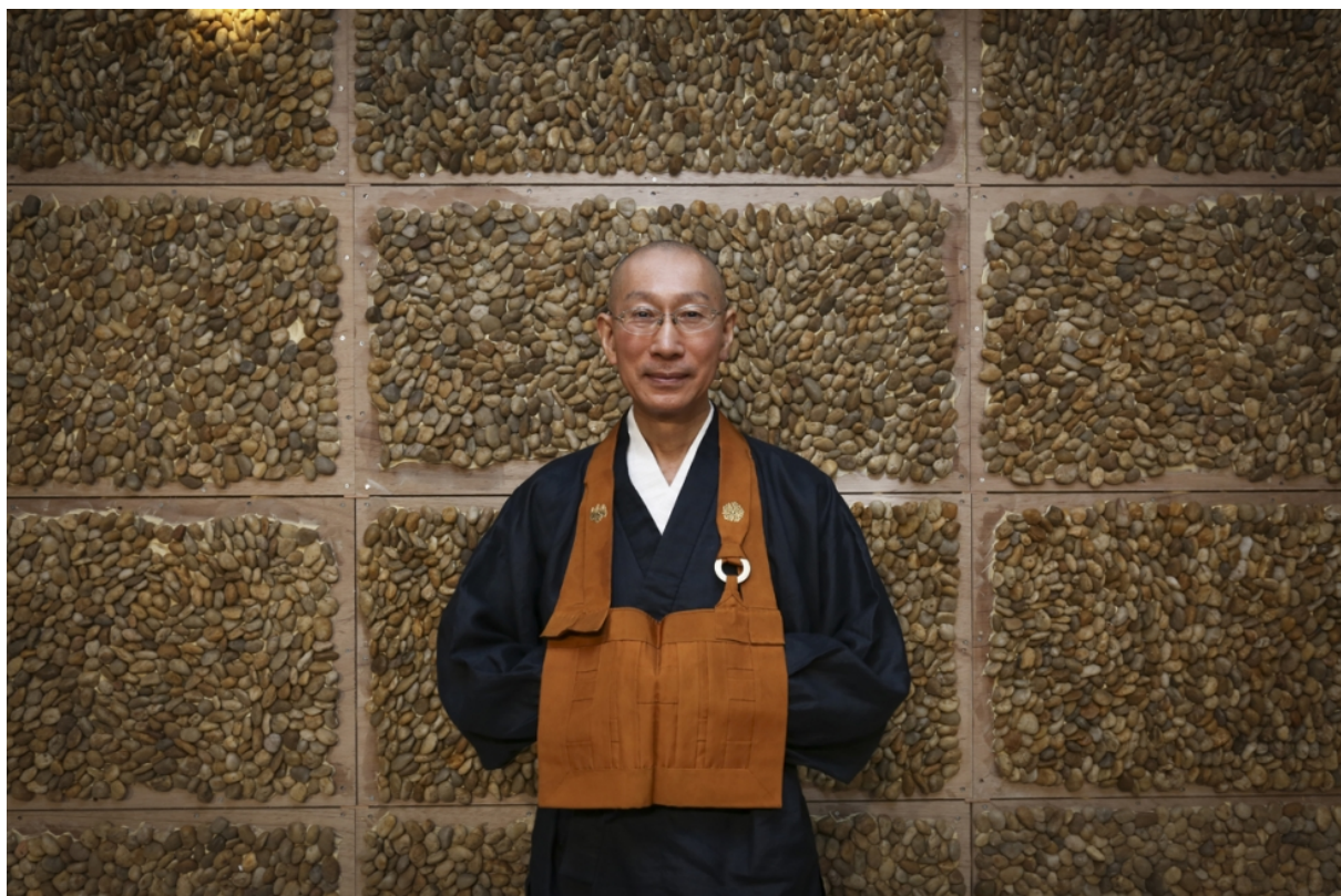
Obr. č. 15 – Shunmyo Masuno (Shunmyo Masuno, 2014: Overseas works)