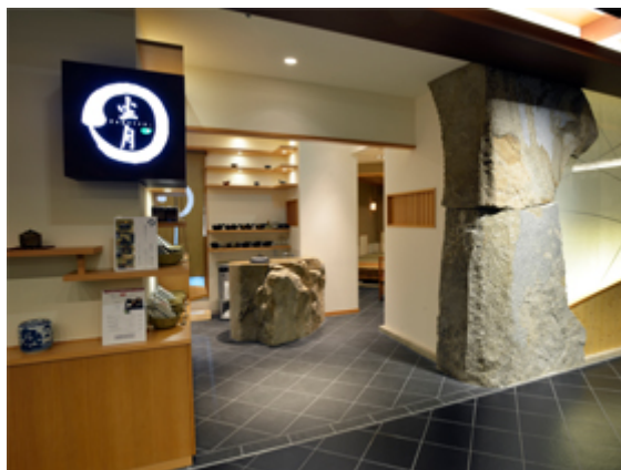
Obr. č. 8 – “Zagetsu” (Shunmyo Masuno, 2014: Domestic works)

Zatím poslední práce pocházející z domoviny autora. Jedná se o interiér designové kavárny, kde opět nechybí masivní prvky kamene a lehký dotyk filozofie zenu.