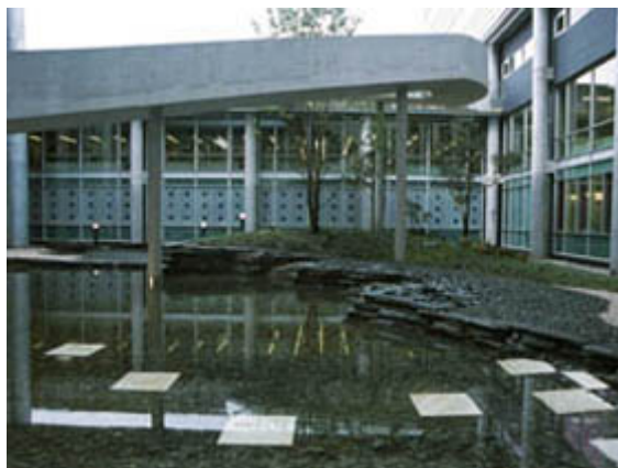
Obr. č. 10 – „Seiyaku no Niwa“ (Shunmyo Masuno, 2014: Overseas works)

Na této zahradě na první pohled zaujmou především kamenné dlaždice zabudované ve vodě. Působí kontrastně s celou poměrně dominantní budovou.