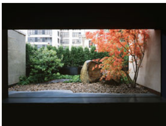
Obr. č. 13 – “Seikan-Tei” (Shunmyo Masuno, 2014: Overseas works)

Realizace menší atriové zahrady, kde se jedná především o hru barev umístěných japonských javorů s kamenným prvkem.