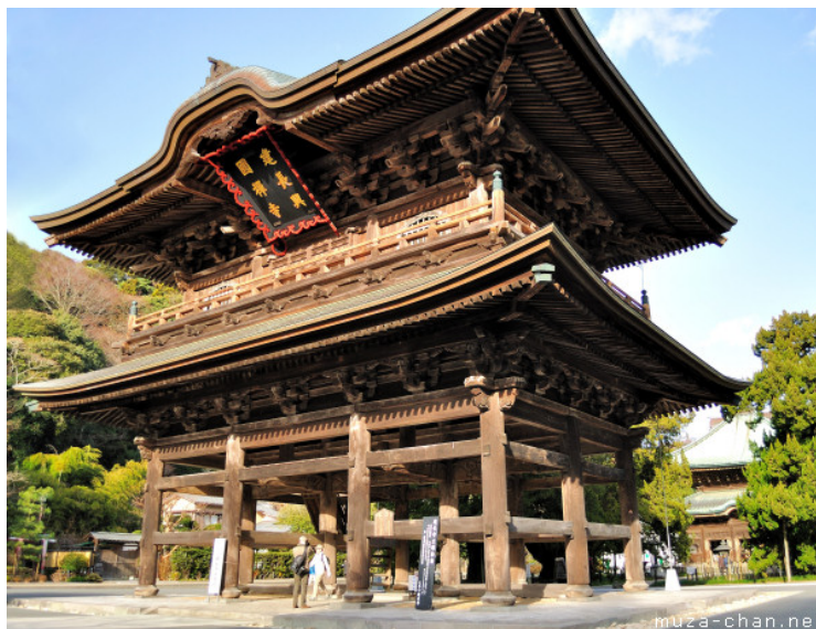
Obr. č. 3 – chrám Kenkohji